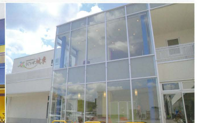
地域密着型特別養護老人ホーム うぐいす城東