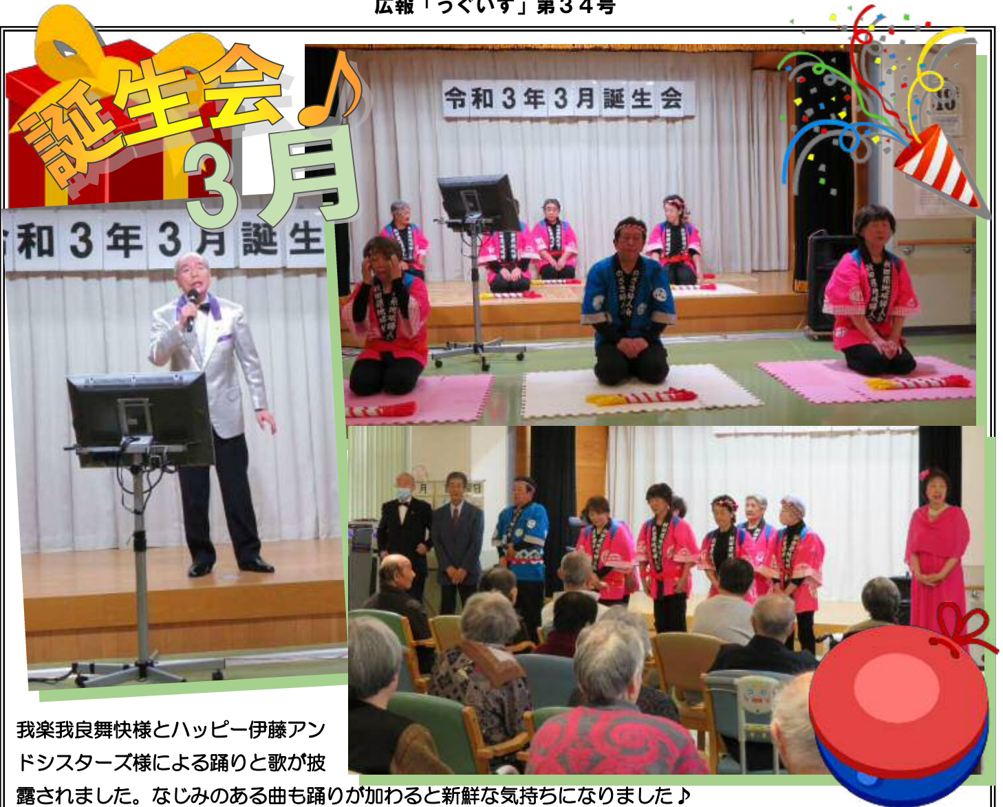
我楽我良舞快様とハッピー伊藤アンドシスターズ様による踊りと歌が披露されました。なじみのある曲も踊りが加わると新鮮な気持ちになりました♪