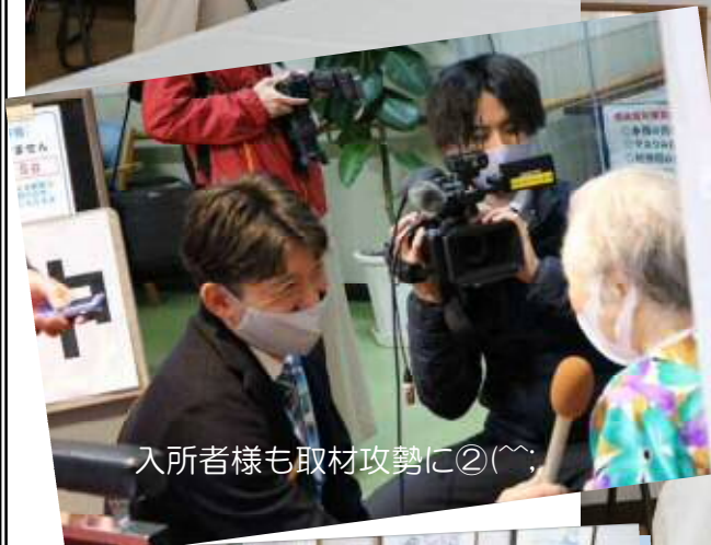
入所者様も取材攻勢に②(^^;