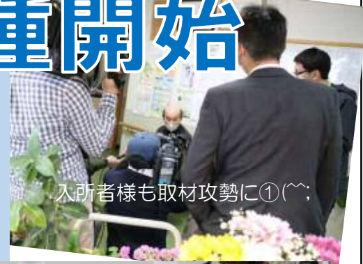
入所者様も取材攻勢に①(^^;