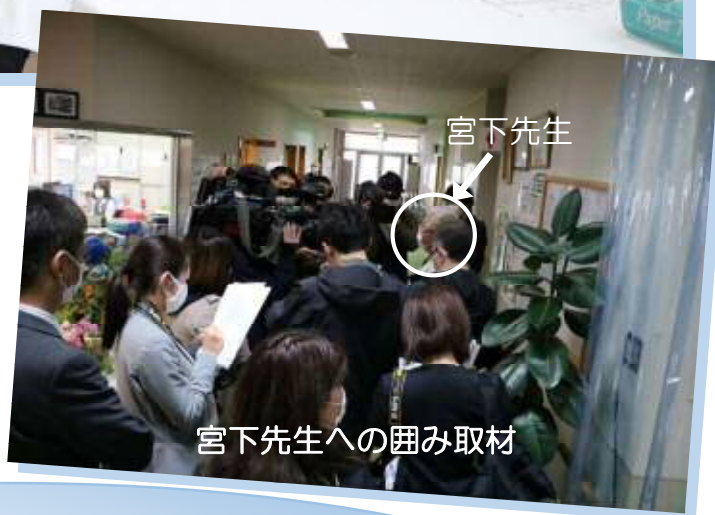
宮下先生への囲み取材