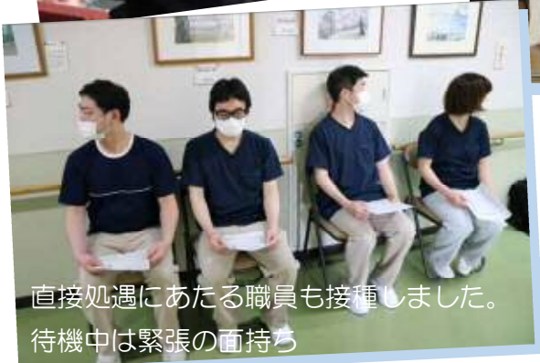
直接処遇にあたる職員も接種しました。 待機中は緊張の面持ち